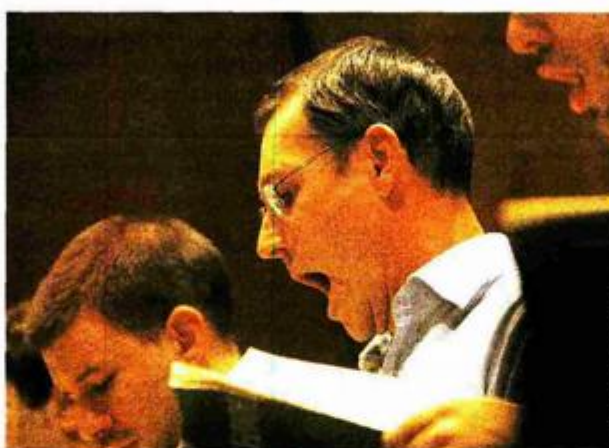
Raspjevani ambasador s goranovcima na probi u Lisinskom

- Odlučio sam tada da se želim baviti sportom i još mnogim drugim stvarima, a dodatni teret redovitih proba u pjevačkom zboru u to vrijeme nisam bio spreman podnositi i potpuno sam prestao pjevati. Bila je to izvanredno glupa i budalasta odluka. Gledao sam kako neki od mojih bivših kolega iz zbora, koji nipošto nisu bili bolji pjevači od mene, dobivaju zbornu stipendiju za Cambridge. Tko zna, da sam